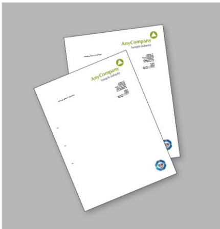
Používanie certifikačnej značky TÜV SÜD v obchodnej komunikácii.