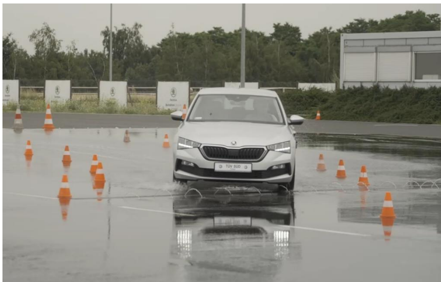
Fot. 2. Przejazdy testowe w celu wyznaczenia granicznej prędkości najazdowej.

W teście zastosowano opony tego samego producenta, modelu, oraz okresu produkcji, różnica dotyczyła głębokości bieżnika ze względu na różną intensywność eksploatacji. W związku z tym konieczna była weryfikacja czy w trakcie okresu eksploatacji nie doszło do ich ponadnormatywnego zużycia związanego z nieprawidłową eksploatacją, a zatem czy były bezpieczne do przeprowadzenia testu, w warunkach torowych. W tabeli poniżej zestawiono parametry opon testowych.