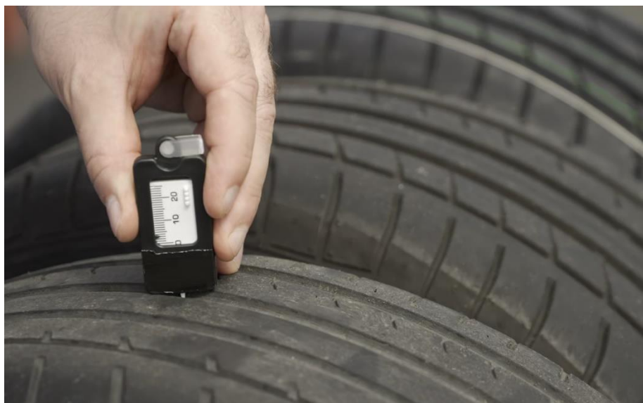
Fot. 1 Pomiar głębokości bieżnika opon testowych.

Przejazdy zostały przeprowadzone samochodem wyposażonym w cztery takie same opony, o głębokości bieżnika 8 mm, a następnie na tylnej osi przeprowadzono zmianę jednego koła wyposażonego w oponę o głębokości bieżnika 5 mm, a następnie 3 mm.