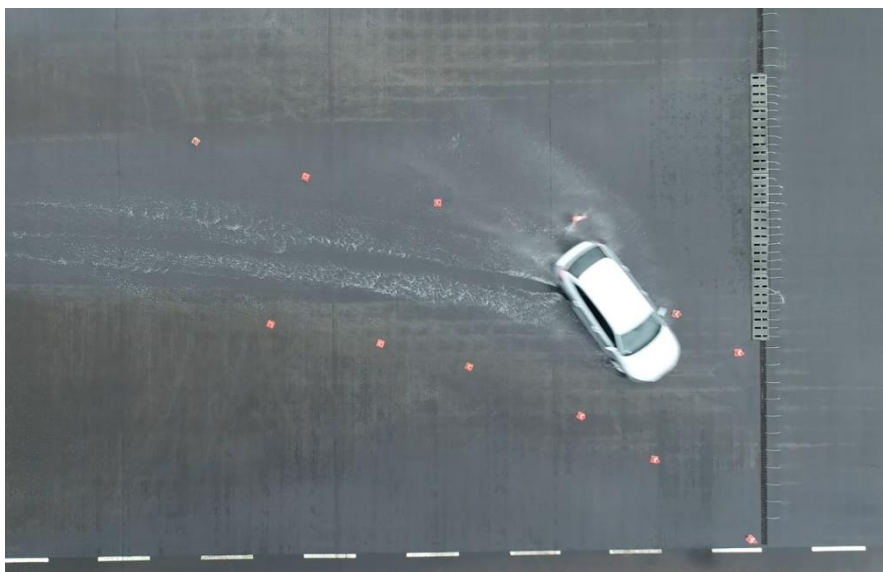
Fot. 3. Przejazd testowy obrazujący nadsterowność pojazdu.

weryfikowano ciśnienie w kołach, do wymaganego 220 kPa. Weryfikację przeprowadzono manometrem posiadającym aktualną kontrolę metrologiczną.