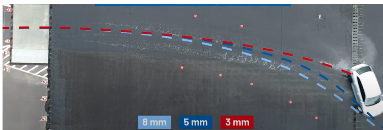
Fot. 6. Zestawienie toru jazdy dla poszczególnych głębokości bieżnika.

W ramach przeprowadzonego testu wykonano trzy cykle przejazdów, a każdy z nich obejmował po pięć prób. W pierwszym cyklu wykorzystano opony z równą głębokością bieżnika na wszystkich kołach, wynoszącą 8 mm. W drugim z cykli przejazdów, przeprowadzono wymianę koła tylnego lewego na koło wyposażone w oponę o głębokości bieżnika 5 mm. Ostatni z cykli obejmował swoim zakresem przejazdu na kole tylnym lewym wyposażonym w oponę o głębokości bieżnika 3 mm.