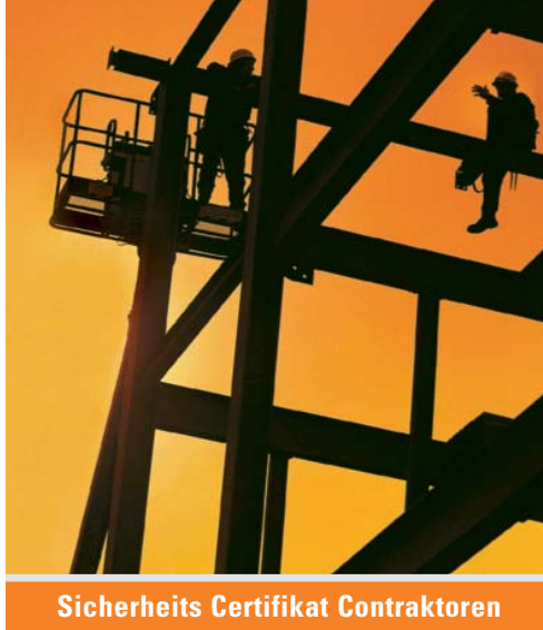
Sicherheits Certifikat Contractoren